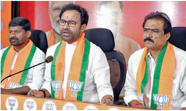
శనివారం బిజెపి రాష్ట్ర కార్యాలయంలో ఏర్పాటు చేసిన మీడియా సమావేశంలో మాట్లాడుతున్న కేంద్రమంత్రి కిషన్ రెడ్డి